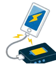
⑩ソーラー発電式 モバイルバッテリー